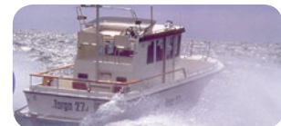
m/y CURIR, 12 passagerare