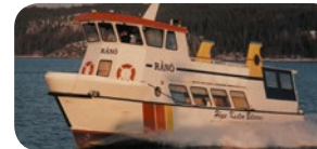
m/s RÅNÖ, 62 passagerare