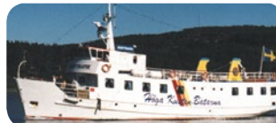
m/s KUSTTRAFIK, 197 passagerare