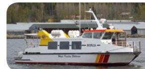
m/s RONJA, 63 passagerare