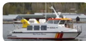
m/s RONJA, 63 passagerare