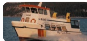
m/s RÅNÖ, 62 passagerare