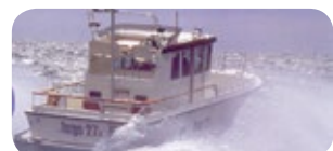
m/y CURIR, 12 passagerare