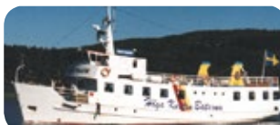
m/s KUSTTRAFIK, 197 passagerare